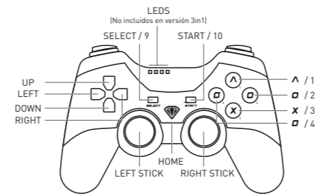
DIAGRAMA DE FUNCIONES: